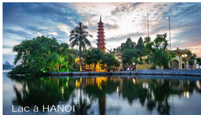
Lac à HANOI