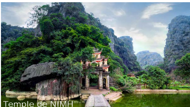
Temple de NIMH

Sur nos prochains bulletins, de nouvelles destinations vous seront proposées pour l'année 2025.